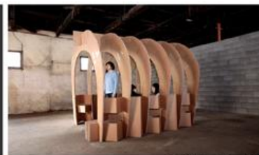
SCALE 1:1 2.4m x 2.4m